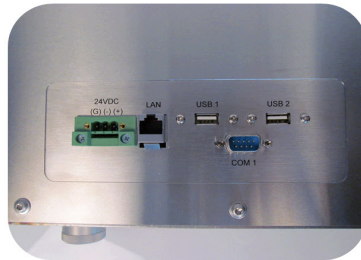
IP54 Standard (à brancher)