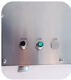
IP65 (pour visser)