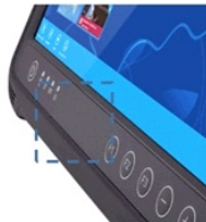
Lecteur RFID HF