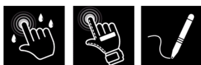
Main / Pluie

Le capteur PPCE tactile peut être utilisé comme un multi-touch. Par application App ou touche de fonction peut être commuté en mode de fonctionnement différent (pluie, gant, stylo). Ceci permet un fonctionnement optimal à différentes conditions de fonctionnement..