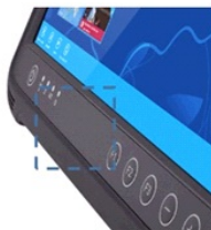
HF RFID Leser