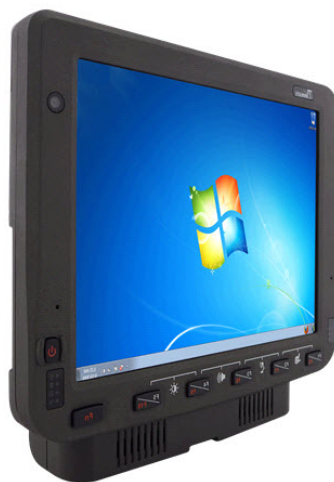
10.4" Vehicle Mount Computer, FM10