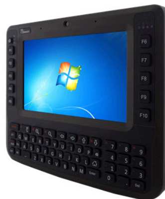
8" Vehicle Mount Computer, FM08